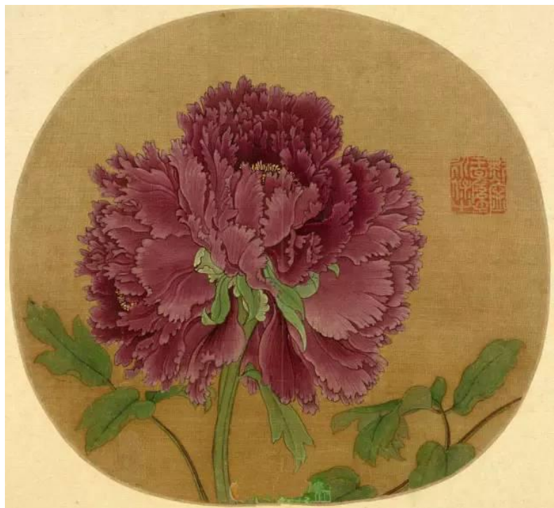
北宋：佚名《牡丹圖頁》