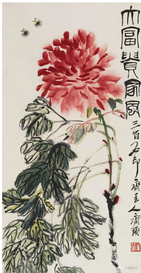
近代：齊白石《大富貴家風》