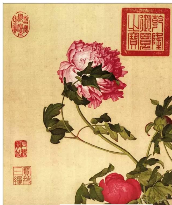
清：齊白石《仙萼長春圖之牡丹》