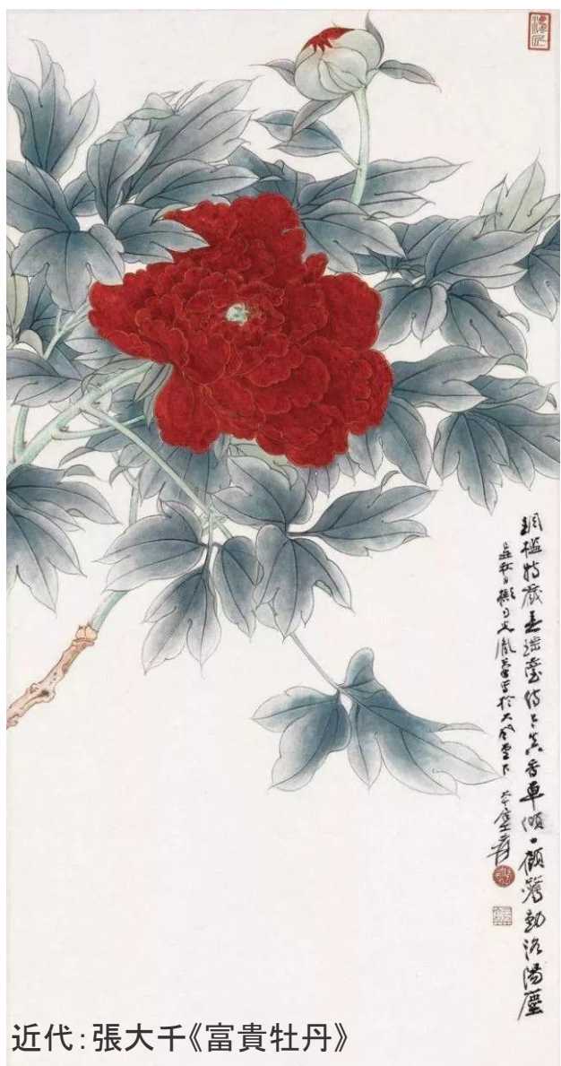
近代：張大千《富貴牡丹》