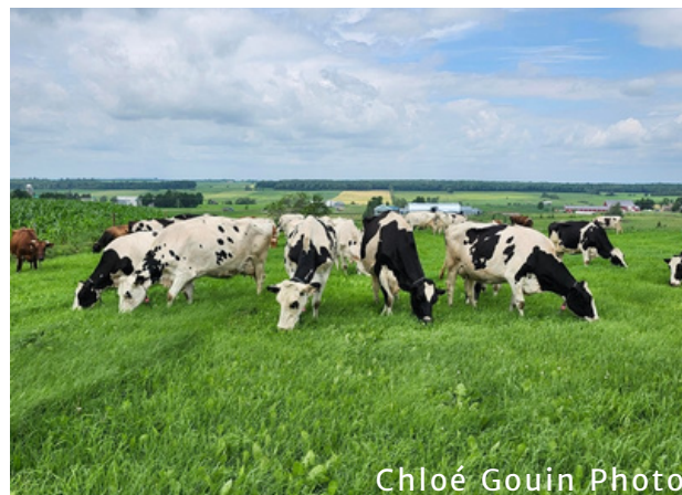
Chloé Gouin Photo