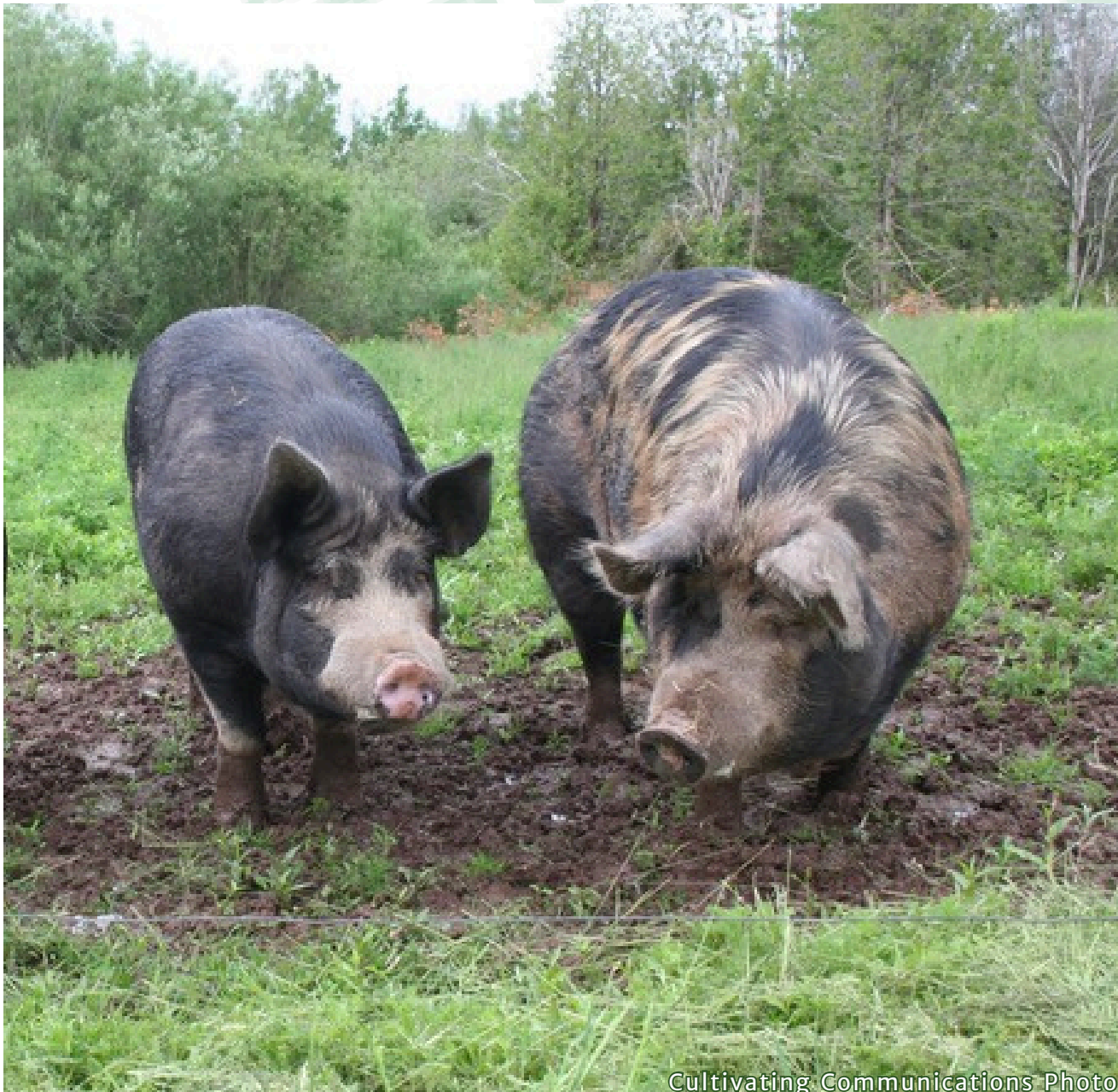
Cultivating Communications Photo

L'ACPF a continué de renforcer son rôle de pôle national de connaissances tout au long de l'exercice 2025-2026. Elle utilise toute une gamme de plateformes numériques et d'outils de communication pour partager des ressources, promouvoir des événements et interagir avec les producteurs, ses partenaires et l'ensemble de la communauté agricole.