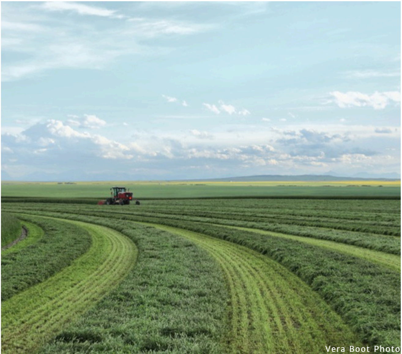
Vera Boot Photo