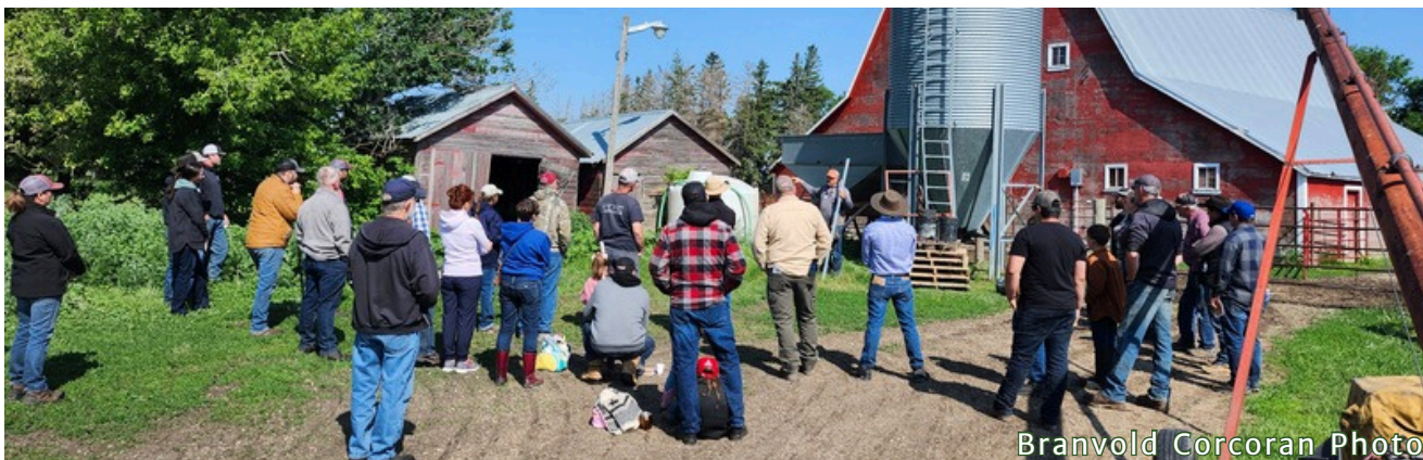
Branvold Corcoran Photo