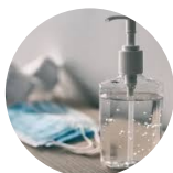
Alcohol en gel