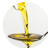
Aceite de cocina

https://connect-hear.com/knowledge-base/strategies-to-keep-clear-windows-from-fogging-up/