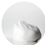
Crema de afeitar