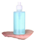
Jabón de mano