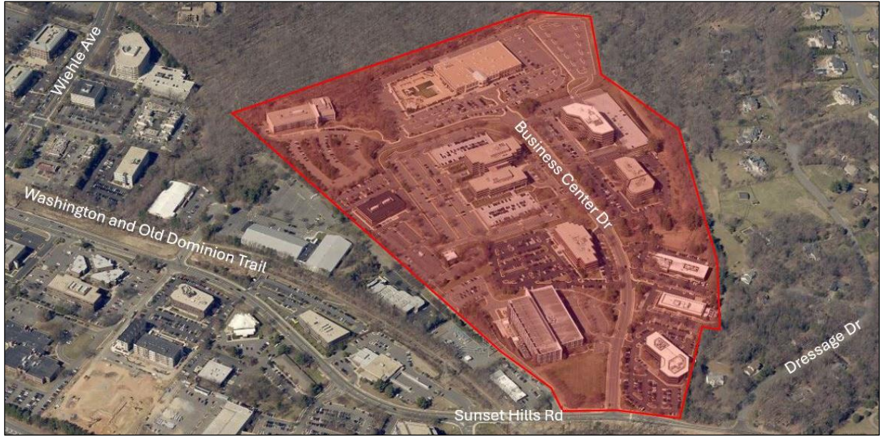
Lake Fairfax Business Center