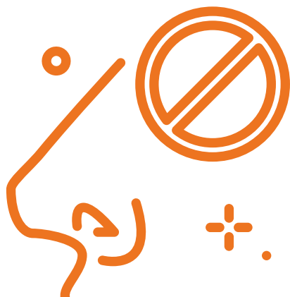
Pérdida Reciente del Olfato o el Gusto