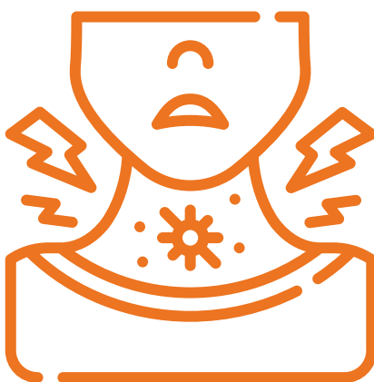
Dolor de Garganta