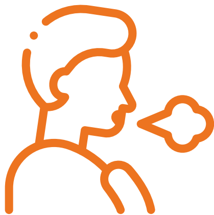
Dificultad de Respirar