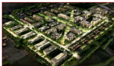
Site pour développement