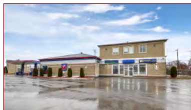
Idéal pour propriétaire occupant