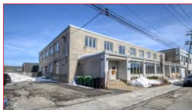
Idéal pour investissement