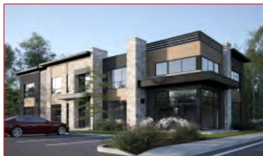
Commercial et bureau

À vendre ou À louer | For Sale or For Lease