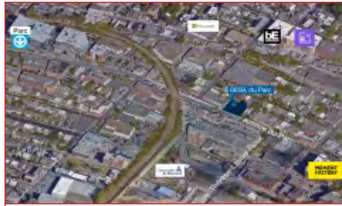
Opportunité de redéveloppement

À vendre ou À louer | For Sale or For Lease