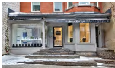
Espace à bureaux bien aménagé