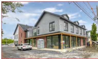
Idéal pour investisseur

Contact : Alhassane Bah Courtier immobilier - Commercial Bureau | Office 514 866 3333 ,305 Cell 514 293 9752