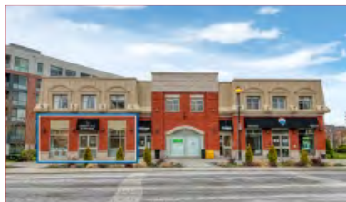
Clé en main