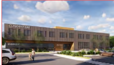
Nouvelle Construction moderne

Gabrielle Saine Courtier Immobilier - Commercial Bureau | Office 514 866 3333 ,262 Cell 514 603 0062