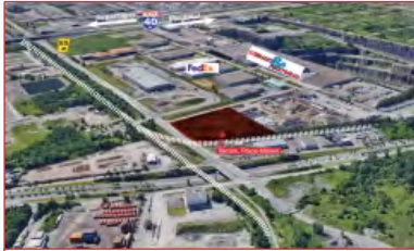
Terrain industriel de 144 096 pi 2