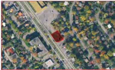
Terrain de 9 044 pi 2

Contact : Laurent Lauzon Courtier immobilier - Commercial Bureau | Office 514 866 3333 ,307 Cell 514 238 8606