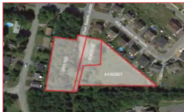
Terrain de 120 195 pi 2