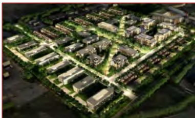
Site pour développement

Contact : Nathalie Légaré Courtier immobilier - Commercial Bureau | Office 514 866 3333 ;314 Cell 514 295 0805