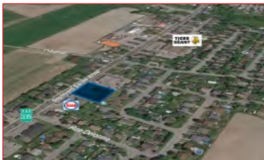
Développement sur mesure