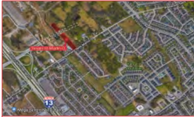
Terrain à vendre