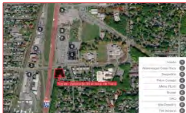
Nouveau sur le marché