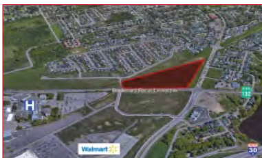
De retour sur le marché