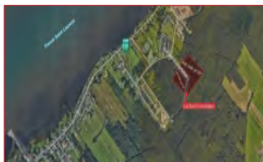
Pour construction d'habitation