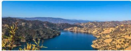
Chapter 5: Climate Adaptation Measures