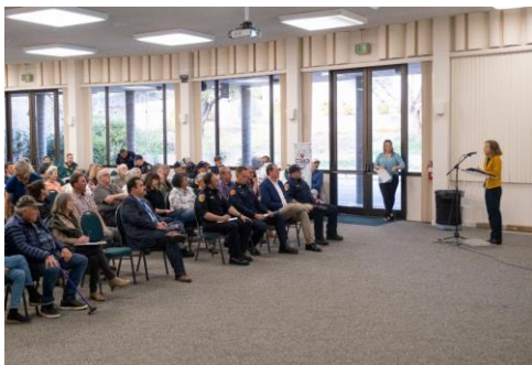
Evento de preparación para la primavera

Obtenga más información sobre el Grupo de Trabajo y su trabajo continuo en wildfiretaskforce.org .