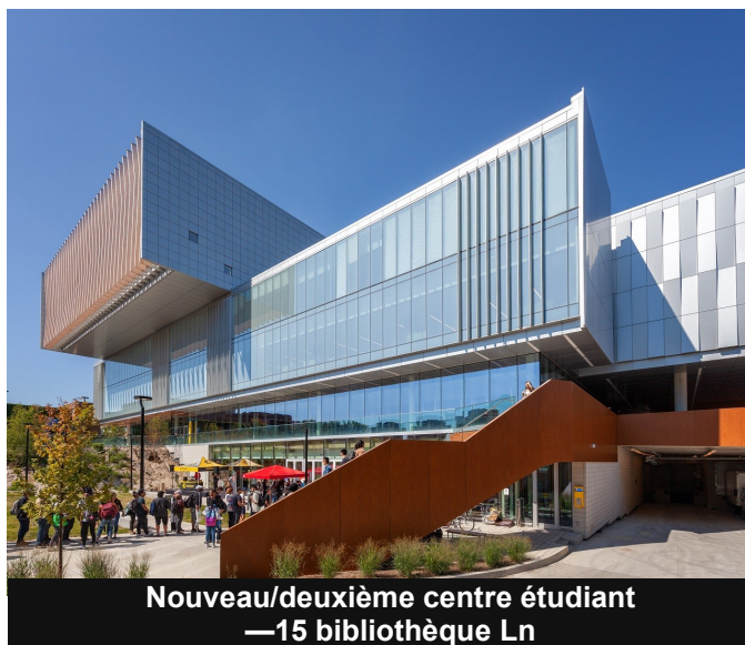
Nouveau/deuxième centre étudiant —15 bibliothèque Ln