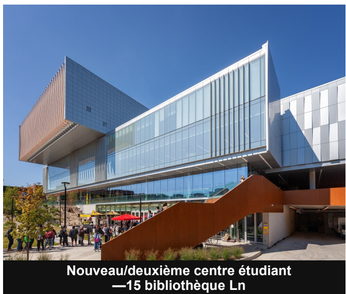
Nouveau/deuxième centre étudiant —15 bibliothèque Ln

P Zones avec stationnement de surface / rue. Coût (maximum): 1,75 $ / demi-heure (15,00 $ max)