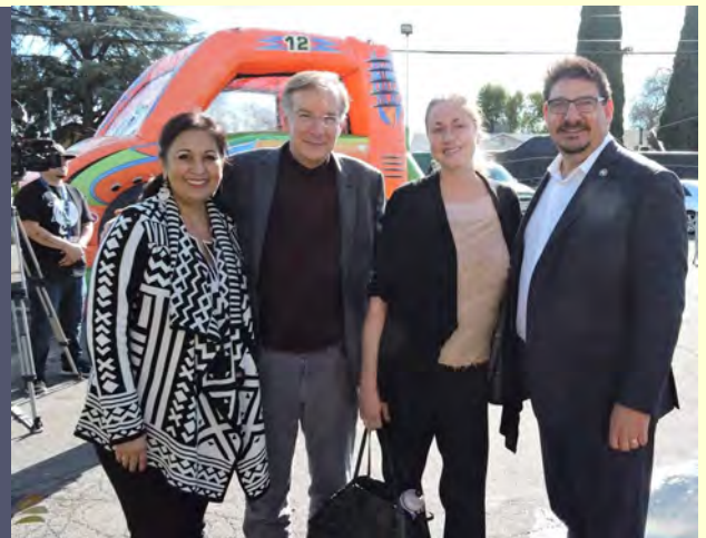
SACOG Grant Celebration January 30, 2016