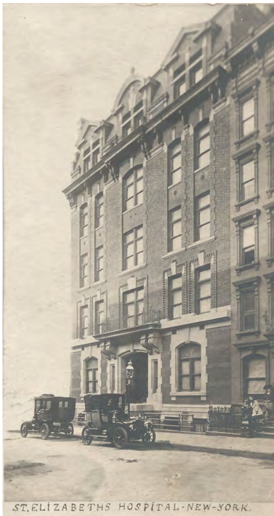
EL HOSPITAL SANTA ELIZABETH, CIUDAD DE NUEVA YORK, C. 1904. MÁS TARDE, EL EDIFICIO SE CONVIRTIÓ EN EL HOSPITAL SANTA CLARA