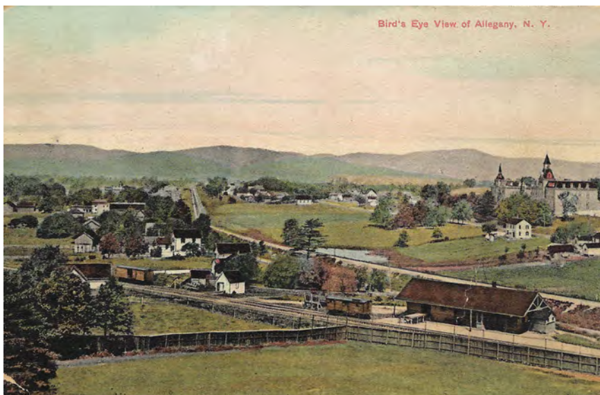
VISTA DE PÁJARO DE ALLEGANY, NY, POSTAL, C. 1900. OLD LA ANTIGUA CASA MADRE ES VISIBLE EN EL FONDO A LA DERECHA. LA ESTACIÓN DE TREN DE ALLEGANY VISIBLE EN PRIMER PLANO A LA DERECHA.