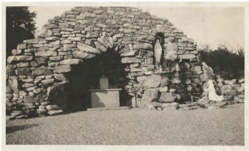
LA GRUTA DE NUESTRA SEÑORA DE LOURDES TODAVÍA SE ENCUENTRA HOY EN EL SITIO DE LA ANTIGUA CASA MADRE, CERCA DEL CEMENTERIO SAN BUENAVENTURA