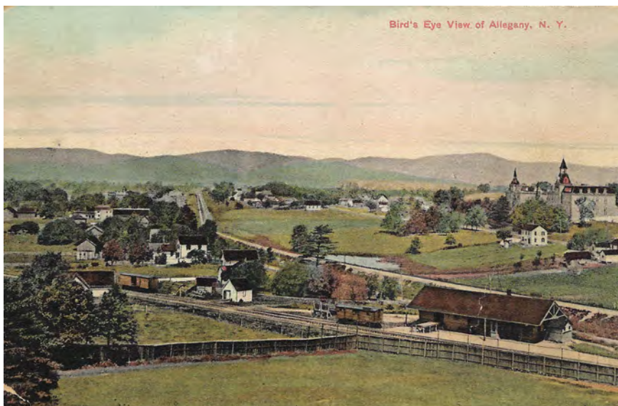
CARTÃO POSTAL C. 1900 - VISTA AÉREA DE ALLEGANY, NY. O ANTIGO MOTHERHOUSE SANTA ELIZABETH PODE SER VISTO AO FUNDO À DIREITA. A ESTAÇÃO DE TREM DE ALLEGANY É VISTA EM PRIMEIRO PLANO AO LADO DIREITO.