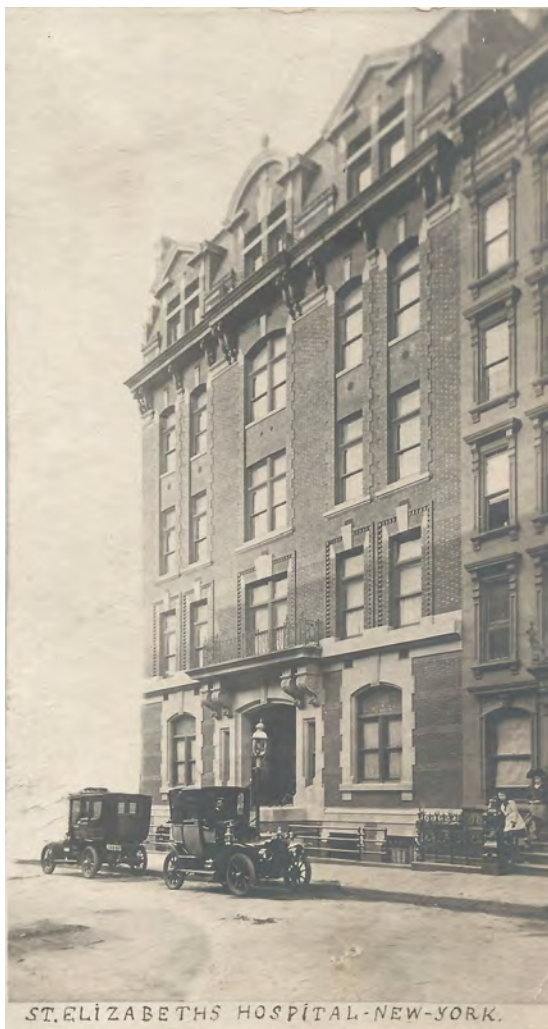
HOSPITAL ST. ELIZABETH, NOVA IORQUE, C. 1904. MAIS TARDE SE TRANSFORMOU NO HOSPITAL ST. CLARE.

Em 1919, seus sessenta anos como irmã foram celebrados com muito menos cerimônia e a única lembrança deste jubileu existente nos Arquivos do Motherhouse é um lindo Buquê Espiritual presenteado pelas alunas da Academia. Cada oferenda espiritual é artisticamente impressa e iluminada com desenhos florais feitos em tons pastéis requintados. O