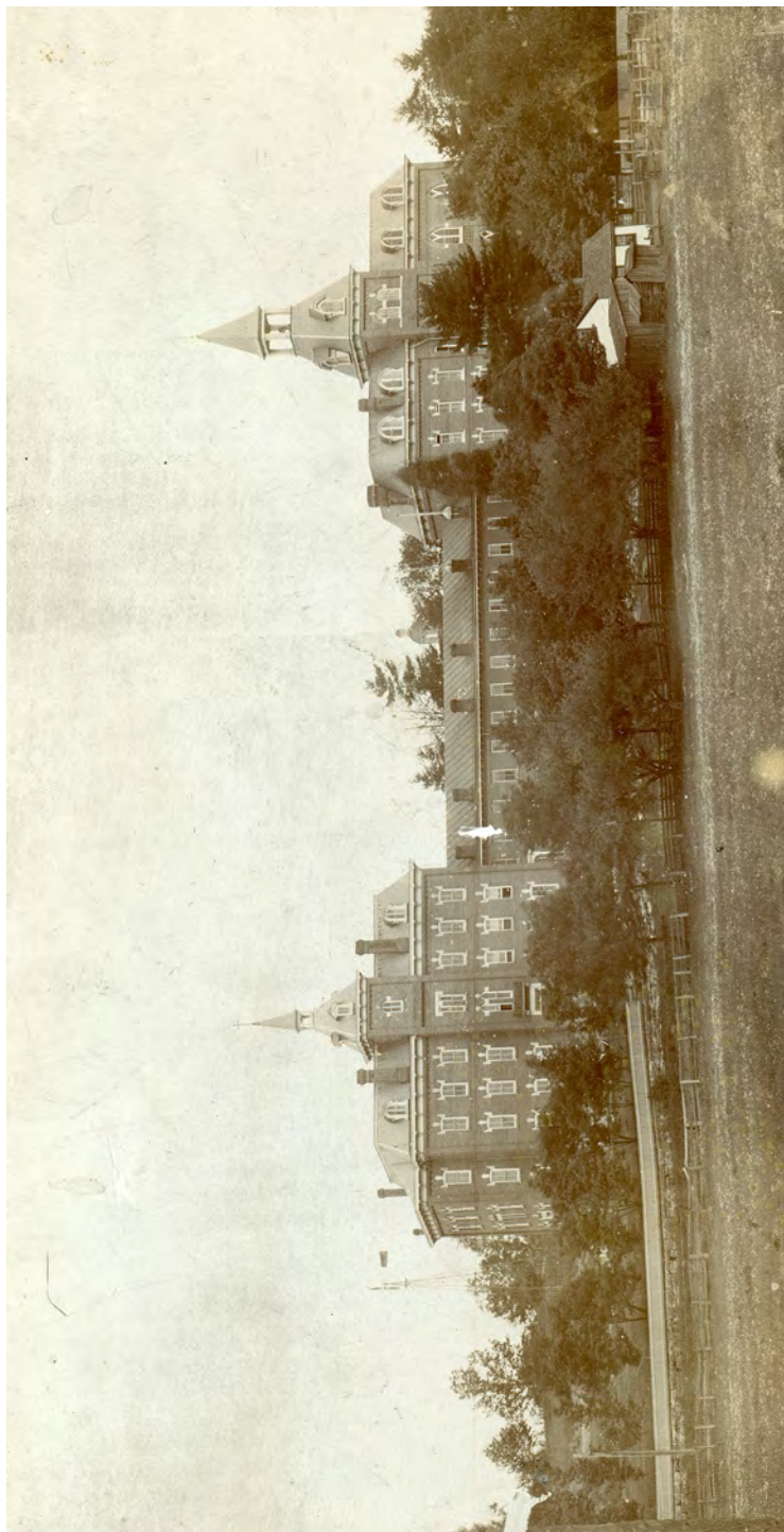
ST. ELIZABETH'S MOTHERHOUSE E A ACADEMIA, C. 1898