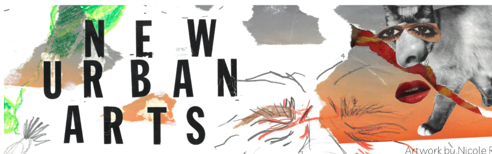
Artwork by Nicole R.

Por Qué: NUA tiene programas de cocina, música, costura, diseño, prácticamente cualquier forma de arte que se pueda imaginar. También ofrecen "estudio virtual" si solo quieres pasar el rato con otros artistas después de la escuela.