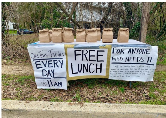
Capital Gazette, May 25, 2020

When I was a kid watching horror movies all those years ago, I confused the exhilaration I felt with true fear. But really it was just a watered-down version of it – as close an approximation to true fear as fruit punch is to absinthe. I always knew the ghosts in the films weren't real and couldn't hurt me, just as I knew my parents were in the next room, at hand to reassure and protect me.