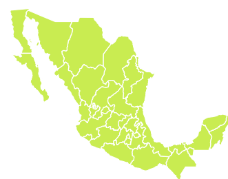
Mexico's historical CPI score

Aunque esta ligera mejora es bienvenida, sigue siendo 6 puntos menor que la puntuación de México en 2014 y significa que el ranking de México todavía es peor que la mayoría de los países en LATAM como Colombia, Cuba y Brasil. Este ranking sustenta la realidad del país, la corrupción en México sigue siendo una amenaza real y perceptible para la realización de negocios en territorio mexicano.