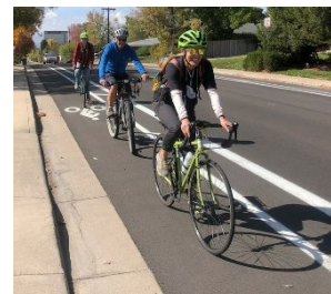
Ejemplo de propuesta infraestructural, Ciclocarril Separado