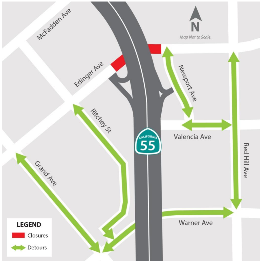
Mapa de desvío de Edinger Avenue