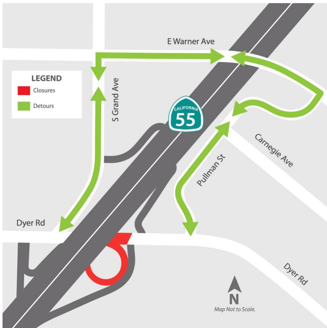
Mapa de desvío de Dyer Road

Las actividades de construcción en curso en los puentes de Dyer Road y Edinger Avenue requerirán el cierre de Dyer y Edinger en dirección este y oeste debajo de la autopista de 9 p.m. a 5 a.m. todas las noches, del lunes 12 de enero al viernes 16 de enero.