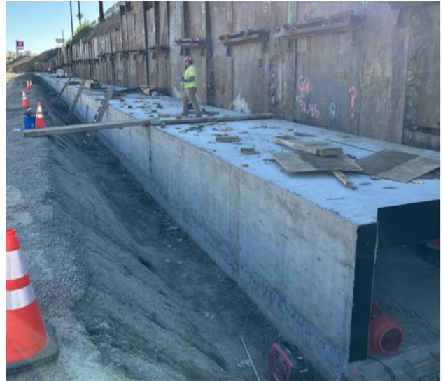
Cuadrillas construyendo el nuevo sistema de drenaje de cajas de concreto armado.

Una vez que se complete ese trabajo, los contratistas demolerán un muro existente y construirán un nuevo muro de contención con un muro de sonido encima. El nuevo muro de contención/muro de sonido tendrá aproximadamente 30 pies de alto y casi 900 pies de largo, extendiéndose a lo largo de la SR-55 en dirección norte, adyacente a la rampa de salida de McFadden Avenue.