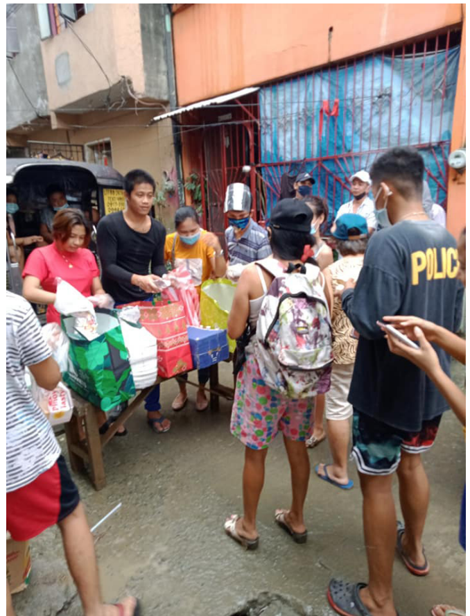
ESQUERDA: MCC Kampala (África)

Atendimento ao HIV/AIDS As igrejas e comunidades espirituais da ICM em todo o mundo continuam com seus ministérios de salvamento de vidas, apesar dos desafios apresentados pela pandemia global.