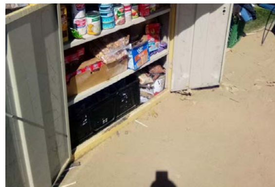
Despensa Comunitaria del “Arbol del Señor” en Fresno, California (EEUU)

Pudimos autorizar muchas comunidades espirituales. “Heridas hacia la Sabiduría” es una comunidad espiritual virtual que se enfoca en la guía espiritual. Esta es la primera en su tipo, y tiene el potencial de seguir creciendo. El “Arbol del Señor” en Fresno, California (EEUU), sigue aliándose con su comunidad para alimentar y asistir a las personas sin hogar. También arrancamos “Travesía”, una comunidad de Belo Horizonte, Brasil, y el “Ministerio Inclusivo Emergente” de la ciudad de Mombasa en Kenia, África. Nuestras comunidades espirituales son sitios para quienes no tienen una ICM local, muchas siguieron en línea durante el pico de la pandemia. Un participante de una comunidad en Viena, Austria, dijo “lo que me gusta de la comunidad de ICM es que tiene una atmósfera de bienvenida, uno puede sentir que el compartir experiencias personales similares y la misma creencia, crea un clima familiar.”