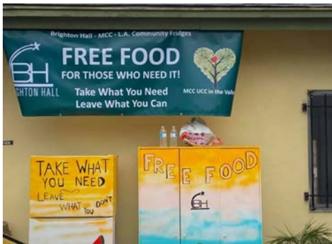
Arriba: ICM del Valle (California, EEUU) Ministerio de Alimentos.