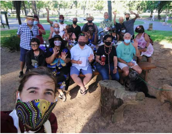
Arriba: ICM Good Hope (Cad. del Cabo, Sudáfrica), “Villancicos en el Parque”