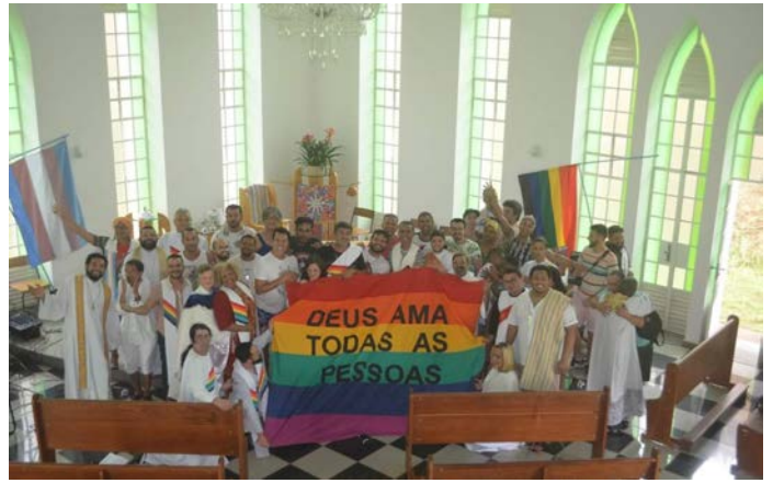
Arriba: ICMs de Brasil en culto compartido.