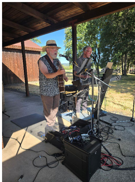
Imágenes del evento, Picture It! y el dúo musical Too Much Fun! en el Museo del Condado de Mendocino.