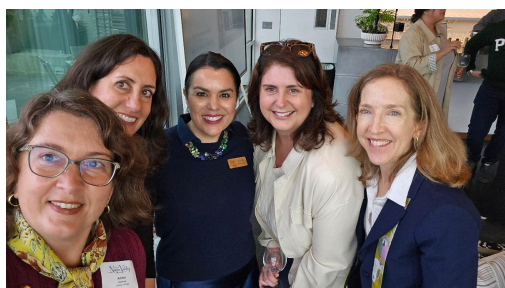
Celebración "mejor del club" de Great Wine Capitals 2026