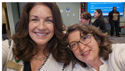
Evento del Mes de la historia afroamericana de HHS