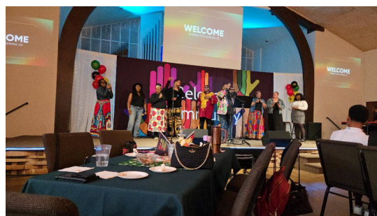
Evento del Mes de la historia afroamericana