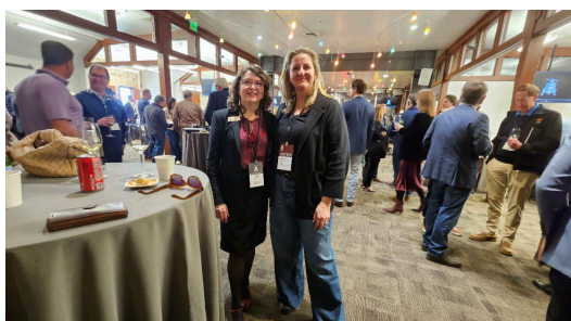
Evento "Premier Napa Valley" de Napa Valley Vintners