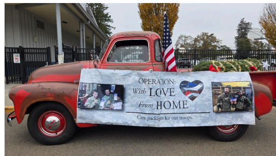
Operación con amor desde casa