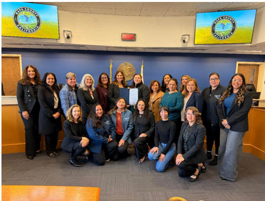
La Junta presentó una proclamación en la que se reconoce enero de 2026 como "el mes de la concienciación sobre la crianza positiva."