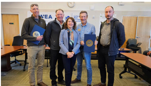
Día mundial de los humedales 2026