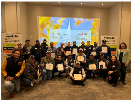
Cultivar360 ceremonia de graduación