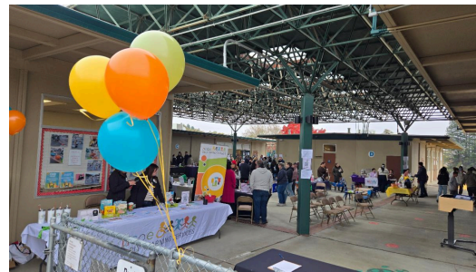
Gran inauguración del centro de aprendizaje temprano de NCOE