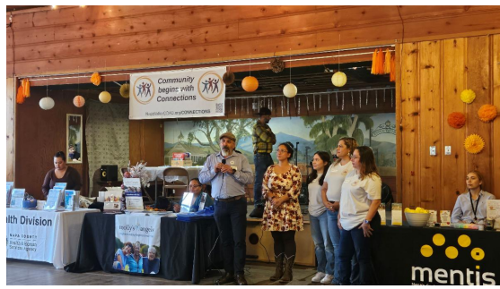
Lanzamiento de Conectoras comunitarias de COAD