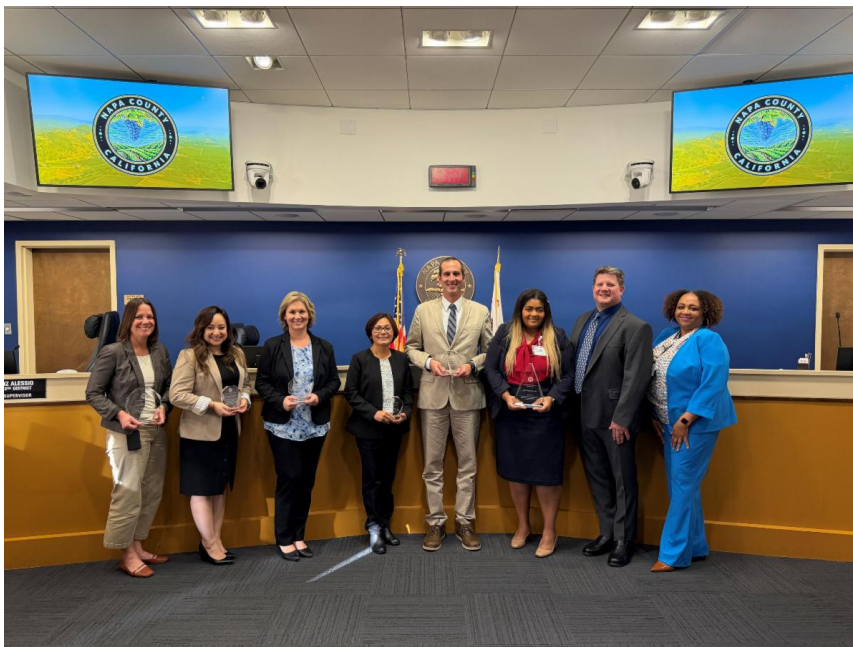
El director ejecutivo y la junta de supervisores presentaron los Premios de Reconocimiento a los Empleados del Condado de Napa 2025