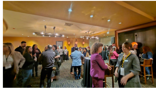
Recepción de la Conferencia sobre Liderazgo Femenino