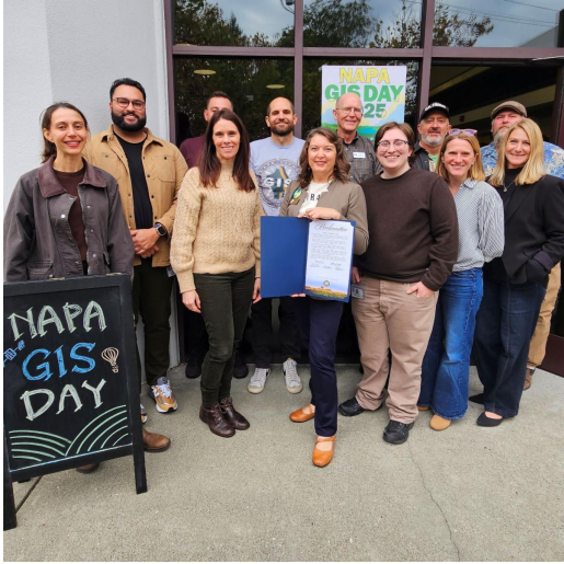
Día de GIS 2025