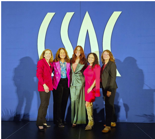
Conferencia CSAC 2025