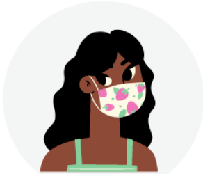
PORTADOR DE COVID-19