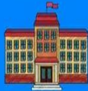
Beit Sefer (Escuela)